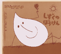
しずくのぼうけん 作…マリア・テルリコフスカ 絵…ボフダン・ブテンコ 訳…うちだりさこ 福音館書店 900円