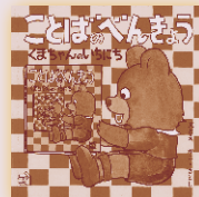
ことばのペンキょう 1~4 文・絵…かこさとし 福音館書店 各600円