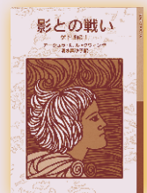
影との戦い ゲド戦記1 著者… アーシュラ・K.ル・グウィン 訳者…清水真砂子 岩波少年文庫 720円