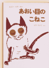
あおい目のこねこ 作…エゴン・マチーセン 訳…瀬田貞二 福音館書店 1,200円