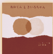
あおくと きいろちゃん 作…レオ・レオーニ 訳…藤田圭雄 至光社 1,200円