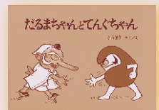
だるまちゃん と てんぐちゃん 作・絵…かこさとし 福音館書店 900円